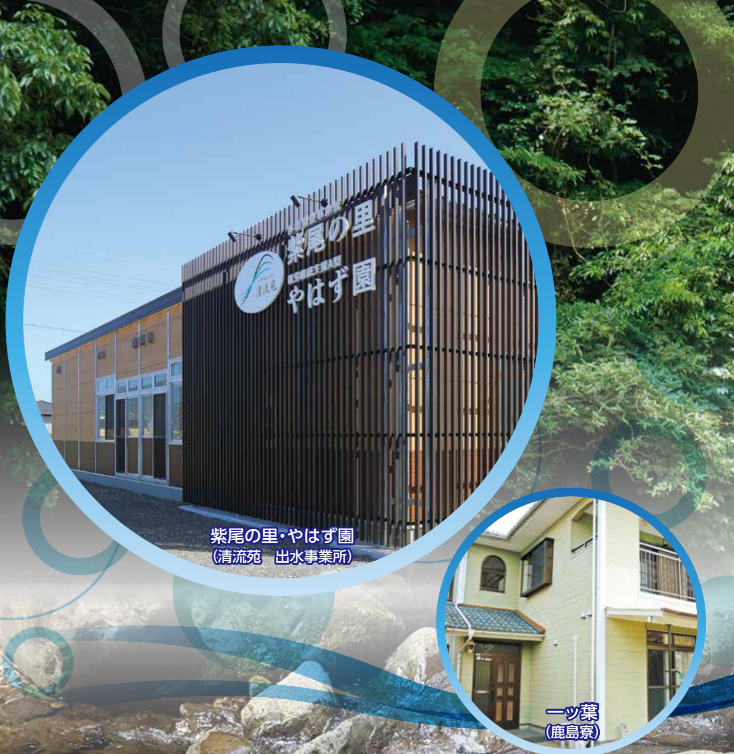
紫尾の里・やはす園 (清流苑 出水事業所)