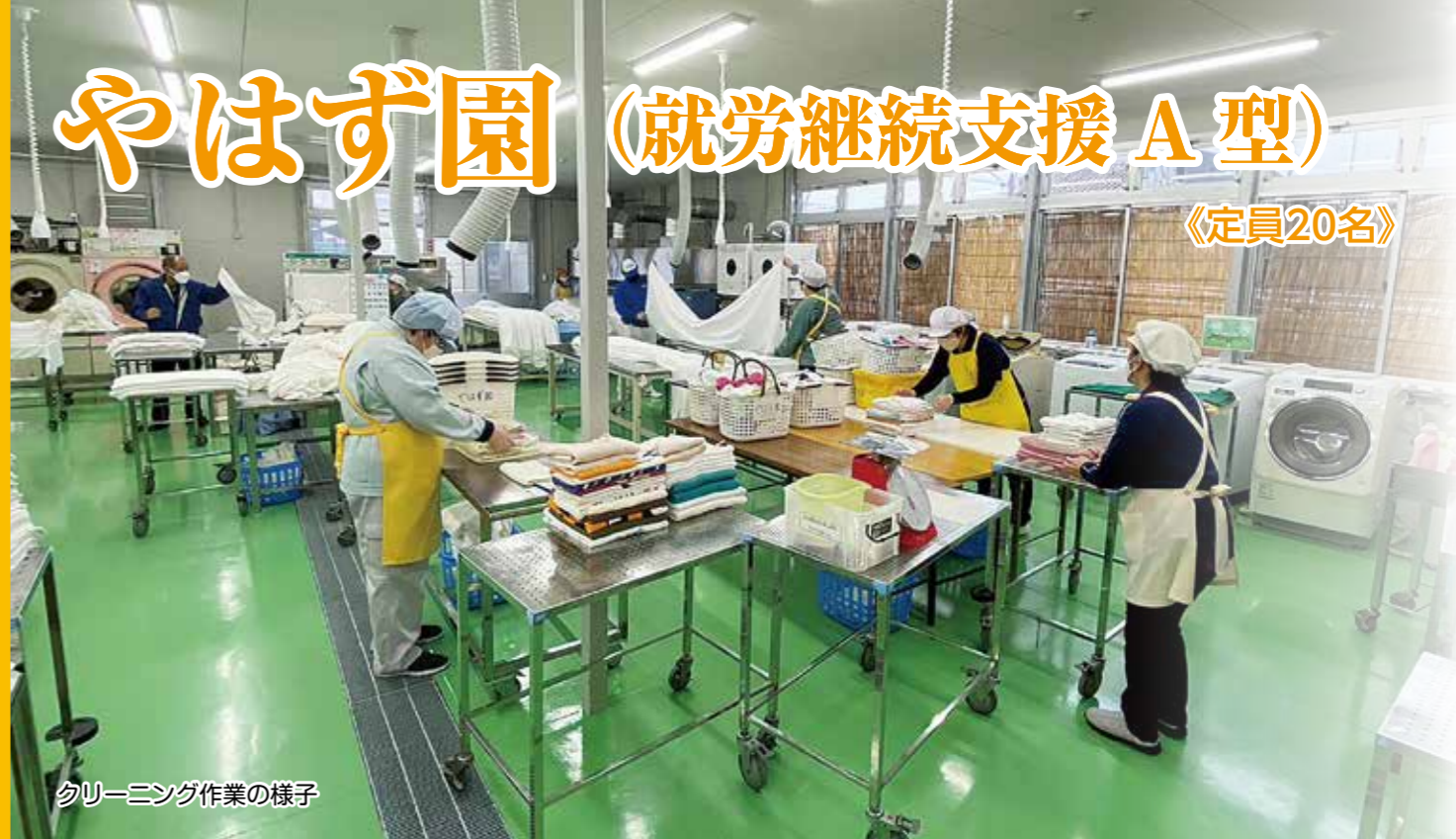
クリーニング作業の様子