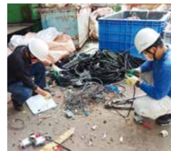
リサイクル分別作業