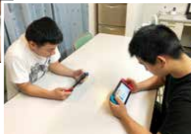
趣味を楽しんでいる様子