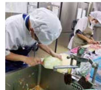
野菜等のカット作業