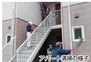
アパート清掃の様子