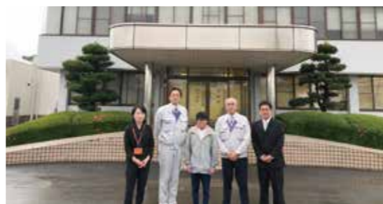
一般就労後もサポートを行います

福祉系サービスの利用を経て、一般就労した障がい者の方が、就労に伴う環境の変化に対応できるように、最長で3年間にわたってサポートを行うサービスです。合わせて、ジョブコーチによる支援も行っています。