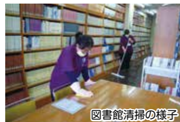
図書館清掃の様子

就労機会と生産活動を通じて、次のステップを目指すことができるように支援します。 紫尾の里の平均工賃額は、33,767円 で出水地区 No1 です。