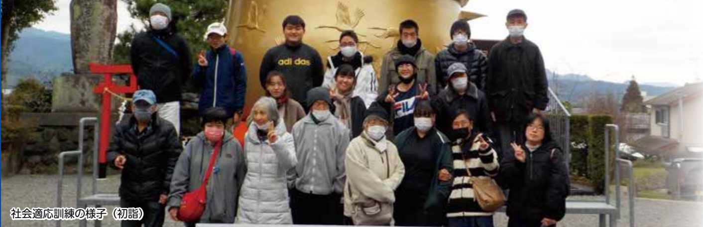
社会適応訓練の様子（初詣）