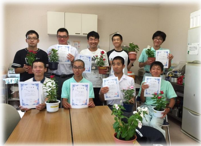
前期修了式の様子