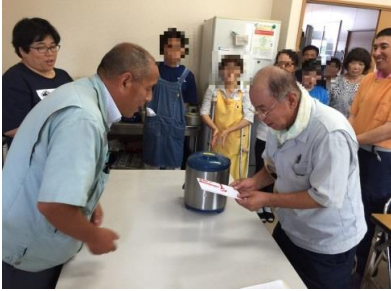
平成27年度皆勤賞の外野さん