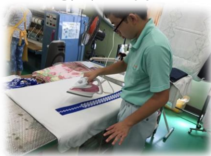
クリーニングでのアイロンがけ