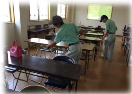
(株)マツバラでの清掃作業