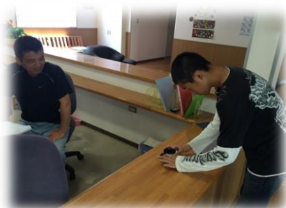
お茶の出し方の訓練