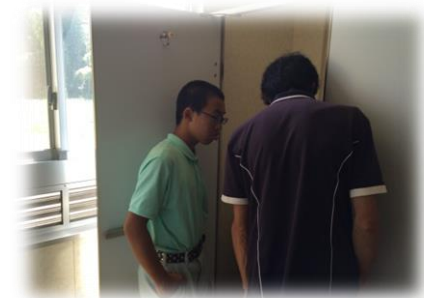
労働体験学習の様子