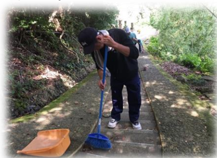
墓守・家守サービス