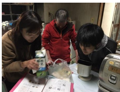
世話人と調理の学習