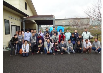
みんなで記念撮影

去る11月14日（土）に水俣市の産業団地内で行われた、「産業団地祭り」を見学に行きました。利用者の皆さんは、まず昼食のあと、産業団地内で行われていたスタンプラリーに参加しました。スタンプラリーの参加景品は肥料かトイレトーパーだったため、やはすファームで利用できる肥料をたくさんいただくことができました。